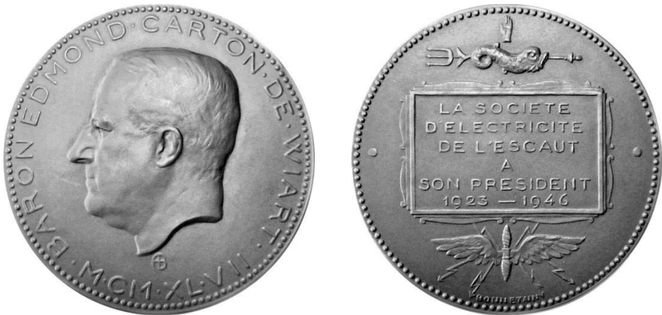
schaal 6 ÷ 7