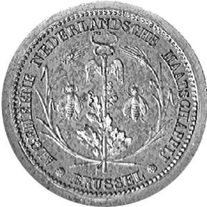
Patrijs Koninklijke Munt Brussel (schaal 500%)

D E HIERONDER AFGEBEELDE PATRIJS vonden we in de archieven van de Koninklijke Munt van België geklasseerd bij het stempelmateriaal van Braemt. Bij het maken van de catalogus van diens werk [1] hebben we lang maar tevergeefs gezocht om hiervan een medaille of penning te vinden. Zelfs het Penningkabinet te Brussel heeft een dergelijk exemplaar niet in zijn verzameling. De vraag rees dan ook of deze stempels wel ooit zijn gebruikt geweest. Vermeld zijn ze in zowel de catalogus van A. de Witte als die van J. Lippens [2] .